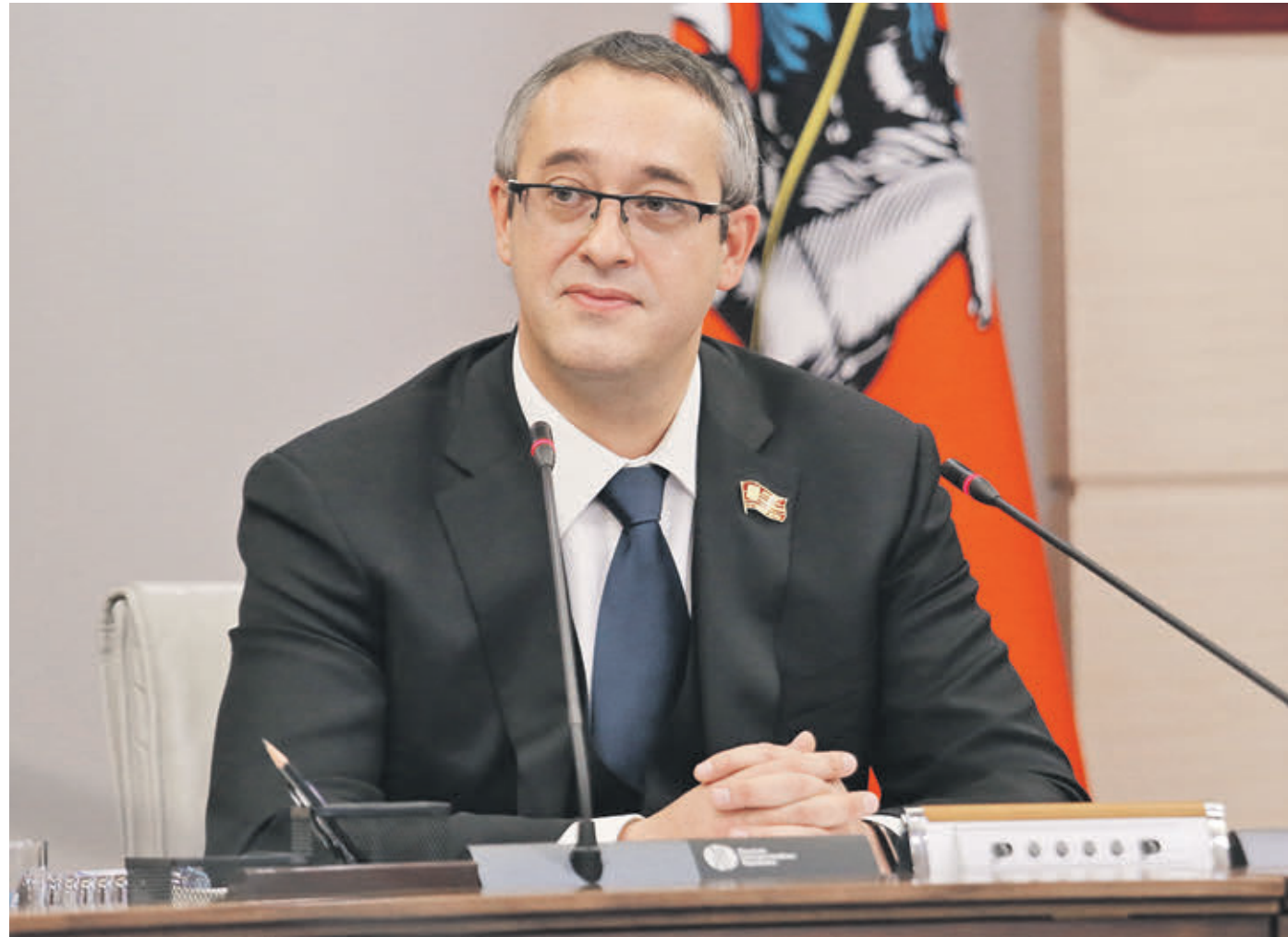
Вчера 13:27 Председатель Мосгордумы Алексей Шапошников подводит итоги работы столичного парламента в период весенней сессии и рассказывает о наиболее значимых изменениях и нововведениях московского законодательства

Борьба с нелегальной миграцией Инициативы московских депутатов регулярно становятся основанием для изменения федерального законодательства, к примеру в период весенней сессии Мосгордума предложила внести изменения в Уголовный кодекс Российской Федерации в части противодействия нелегальной миграции.